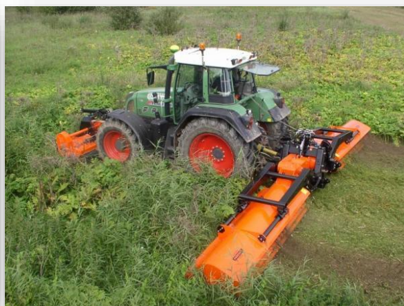
Destruction de jachères